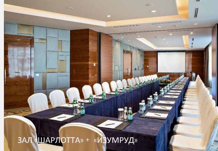
ЗАЛ «ШАРЛОТТА» + «ИЗУМРУД»