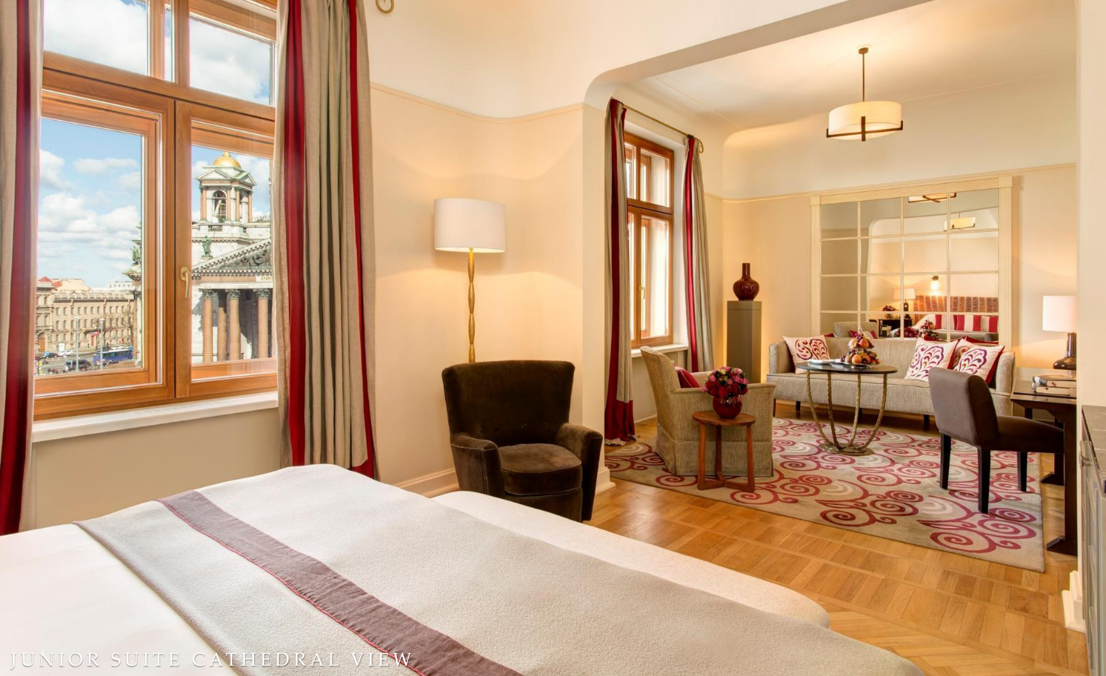
JUNIOR SUITE CATHEDRAL VIEW